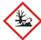
Gevaarlijk voor het aquatisch milieu